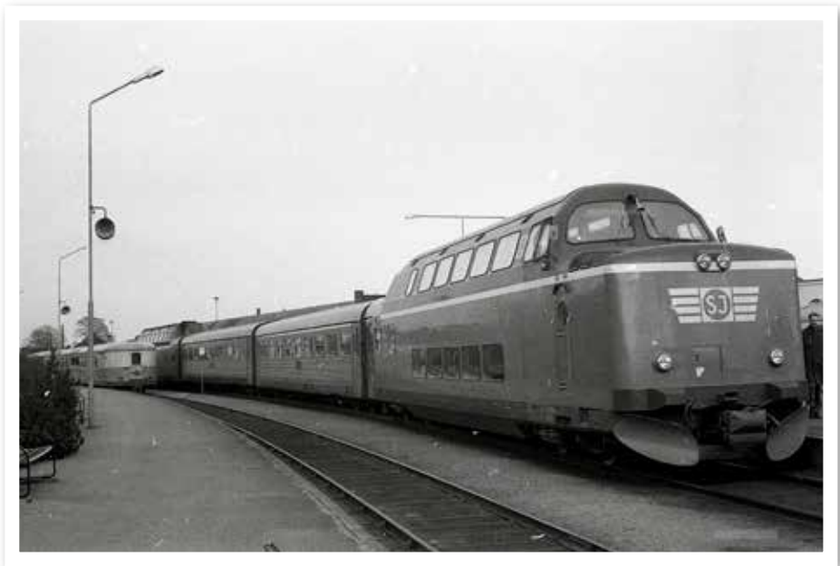
"Kamelen" under sina glansdagar.

Tågen användes mellan Stockholm och Dalarna och i södra Sverige. Snart samlades alla tågen i Malmö och gick i trafik