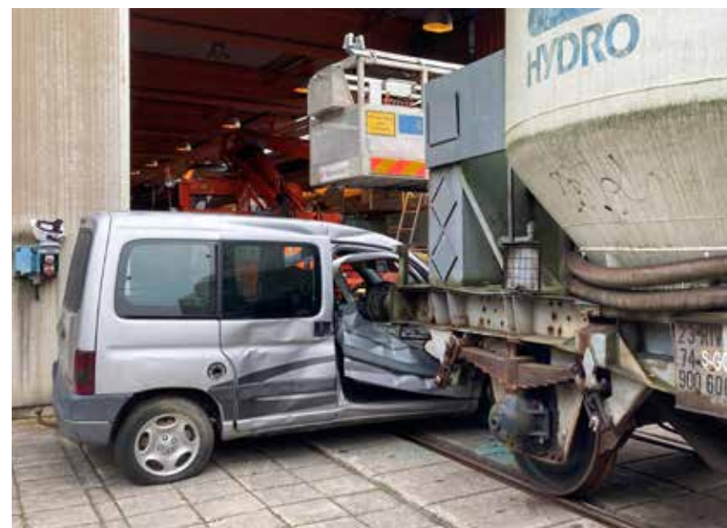
Dramatisk olycka iscensatt.