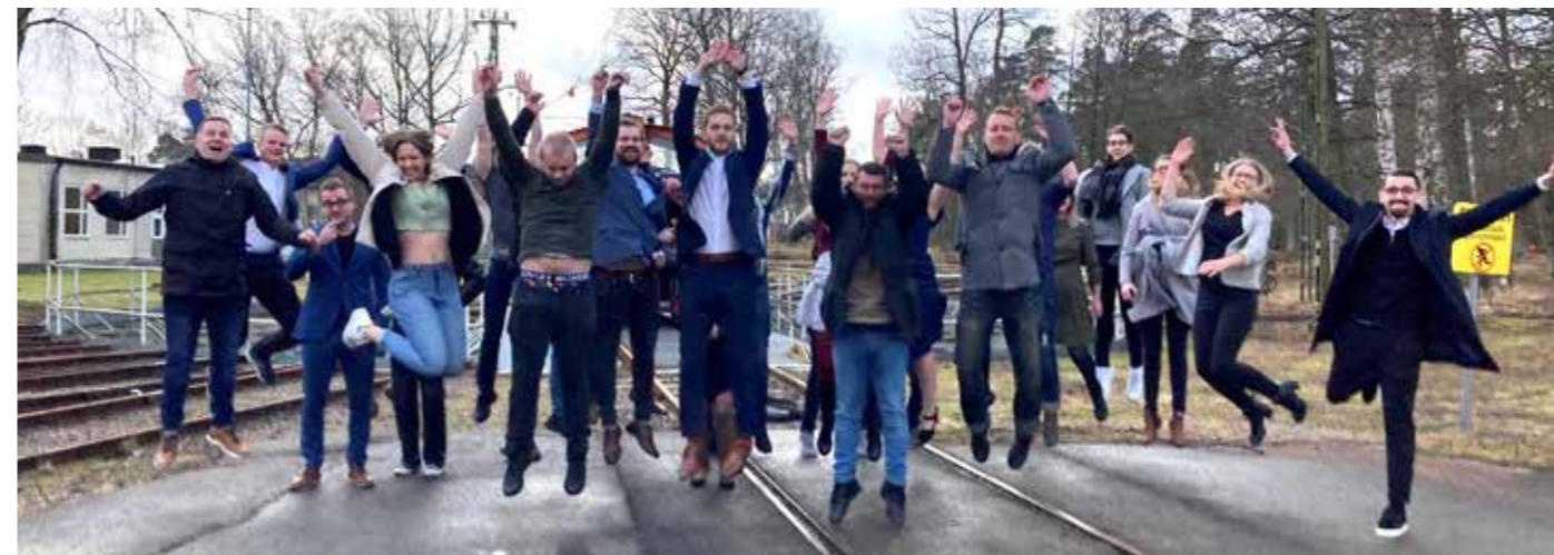
Hoppfulla nyexade lokförare.