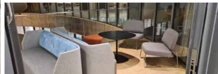
Deltagarna möts av inspirerande miljöer.