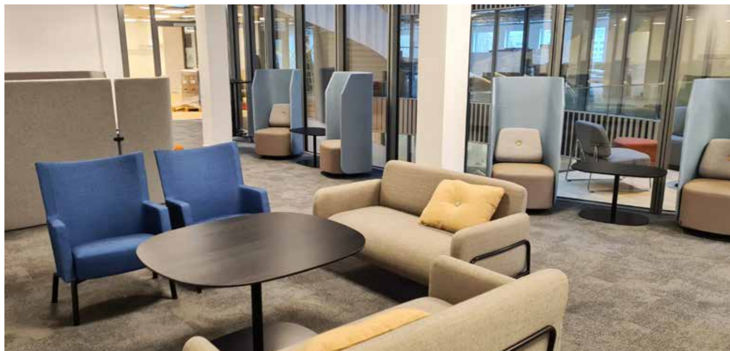
Strax innan kursdeltagarna kommer till Järva.

...Trafikverksskolan finns på Facebook, Instagram och YouTube. Följ oss gärna.