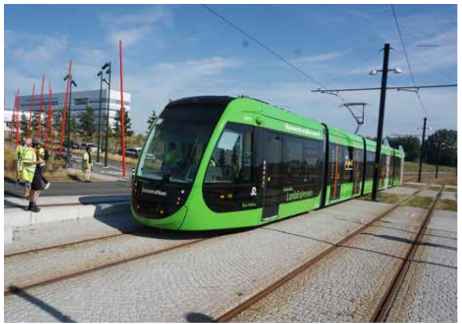
Spårvagnen Åsa-Hanna vid den allra första provkörningen sommaren 2020.